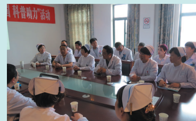
晓店医院院长向我院医护人员表示感谢