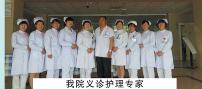
我院义诊护理专家与晓店医院院长及护士长合影