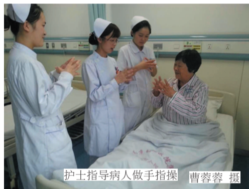
护士指导病人做手指操

指,小指四指将拇指包裹于掌内,左手四指并拢与拇指分开大约 9 度,拇指按压小指根部,反之亦然,同时配以原地踏步。