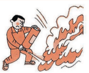
灭火时,一手握住提环,另一手握住筒身的底边,将灭火器颠倒过来,喷嘴对准火源,用力摇晃几下,即可灭火。