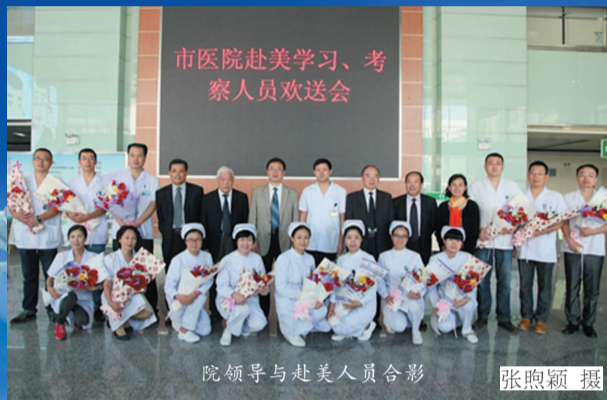
院领导与赴美人员合影