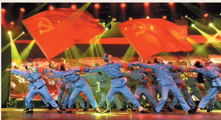
舞蹈《红军不怕远征难》

新的一年,全院将以创建三级甲等医院为目标,紧紧围绕“管理、技术、服务”三条主线,以医疗质量和医疗安全为主题,进一步提升医疗技术水平,改善服务态度,推进医院健康、稳定、和谐发展。该院的全体员工将满怀信心,朝着更高的目标迈进,义无反顾,勇往直前!为共同发展谱写新的篇章,创造新的辉煌!