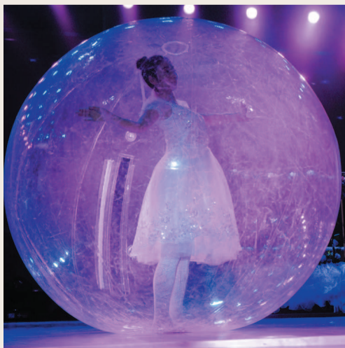
歌舞剧《美女与野兽》